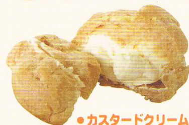
●カスタードクリーム